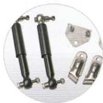
Zubehör: Achsstoßdämpfer für zusätzlichen Fahrkomfort