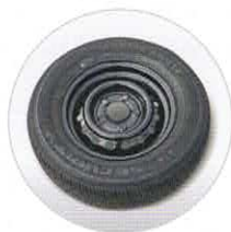
Zubehör: Reserverad mit Halter